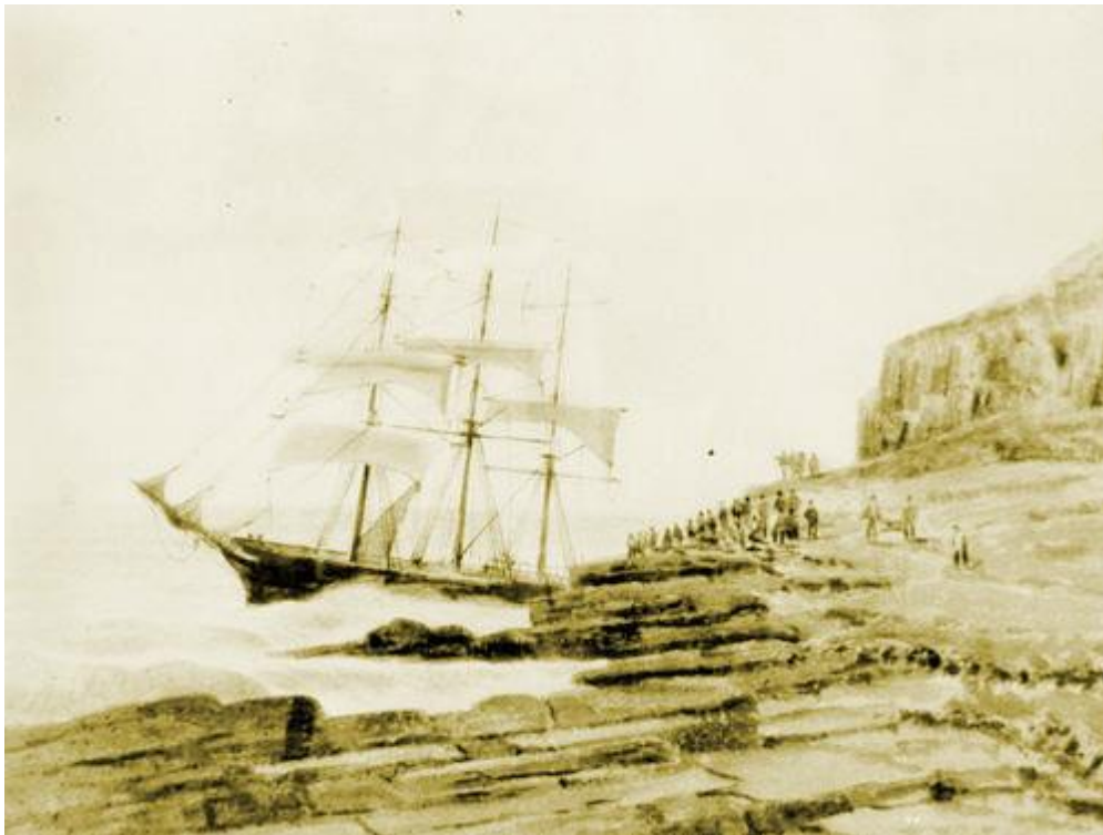
Lammershagens vrak, 1882

I början av 20-talet omvandlades karantänstationen på Peel Island till en lazarette, ett hem för spetälska patienter. År 1882 mötte Lammershagen sitt slut när hon förstördes på en stenig punkt vid Wales kust. En samtida målning spelade in händelsen.