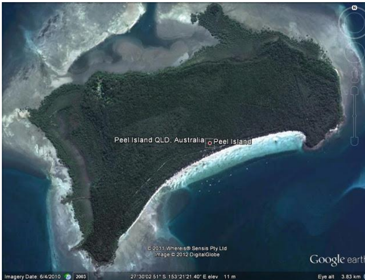
Peel Island, karantänstationen var i nordvästra hörnet

Det var uppenbarligen ett misslyckande från rederiet att se till att passagerarna hade tillräckligt med utrymme god ventilation och proviant. Under resan var det fartygets läkare som ansvarade för att upprätthålla god hygienstandard. En korrespondent till Courier Mail skyllde på skandinaverna bland passagerarna.