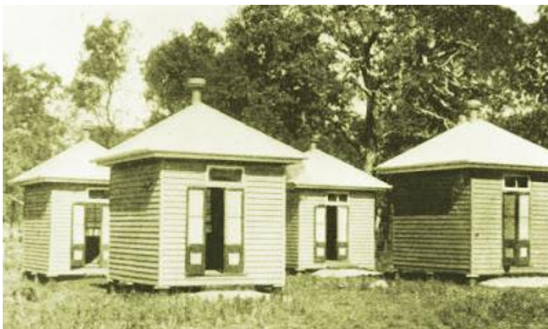
Stugor för spetälska på Peel Island

Invandrarna vid Lammershagen lyckades gräva ut små grottor inför klippan, som de omvandlade till små ugnar och bakade utmärkt bröd däri, men de har alla fallit i förfall nu.