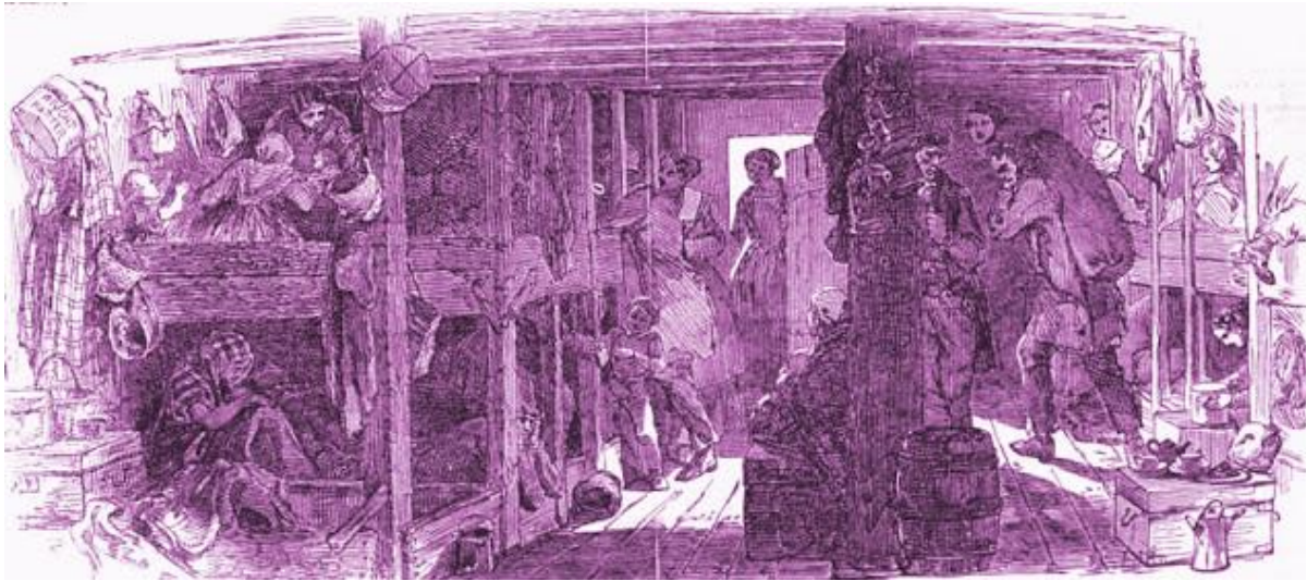
Nedanfö däck på ett trängt emigrantfartyg

Det visade sig att Lammershagen inte bara var överfull, ohygieniska och dåligt ventilerat utan också allvarligt underutrustade. Perfekta förhållanden för utbrott av tyfus, allmänt känd som "skeppsfeber".