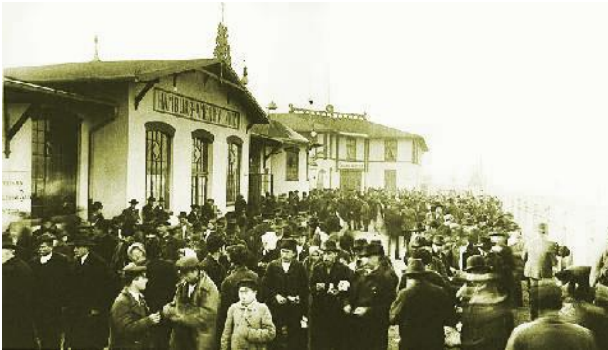
Emigranter som väntar ombordstigning i Hamburg