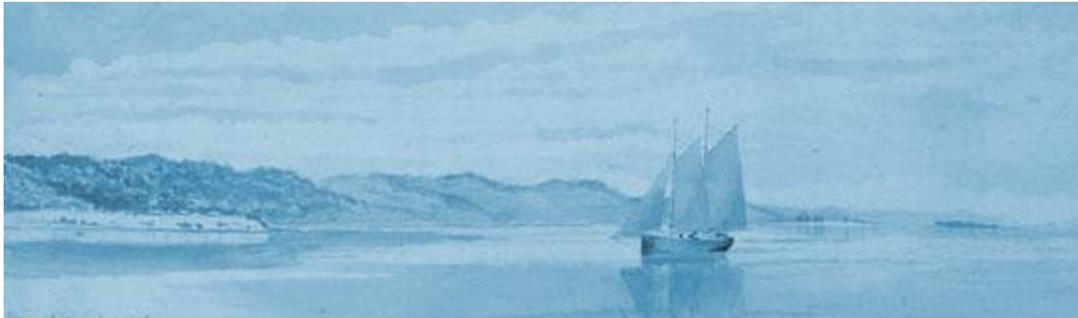
Moreton Bay och Stradbroke Island

Om rapporten inte var felaktigt har de nyanlända ankommit med fartyget och fått en helt annan upplevelse än den de väntade sig, en glad introduktion till sitt nya hem. Utan tvekan har regeringen gjort det bästa de kunde under omständigheterna, men minst sagt var det olyckligt att den första upplevelsen av Queensland som dessa människor fick skulle vara att "läger ut" på en ö i dränkande regn.