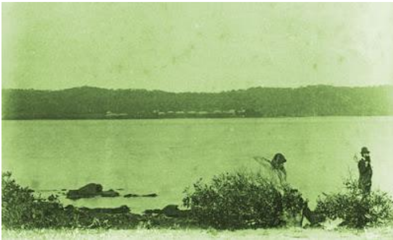
Dunwich sett från Peel Island

Ångbåten Kate, som vid ankomsten från Ipswich den 8:e jan, skickades till viken med allt som behövs för att få passagerarna bekväma som möjligt under rådande omständigheter. Avsikten är att bogsera fartyget till Peel Island, när invandrarna kommer att inkvarteras och förses med tält. Ett tillfälligt sjukhus byggt i trä upprättas för patienterna. De sjuka passagerarna kommer att separeras så långt som möjligt från resten av de andra.