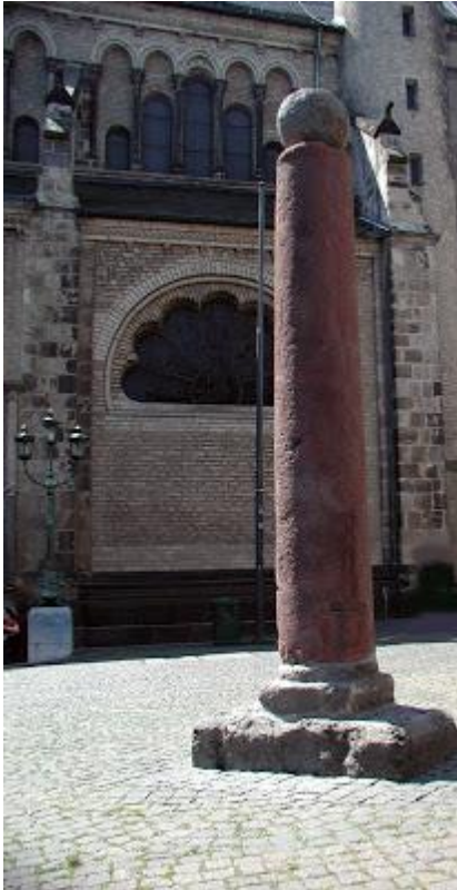
Medeltida "Pranger" eller Pillory, Bonn